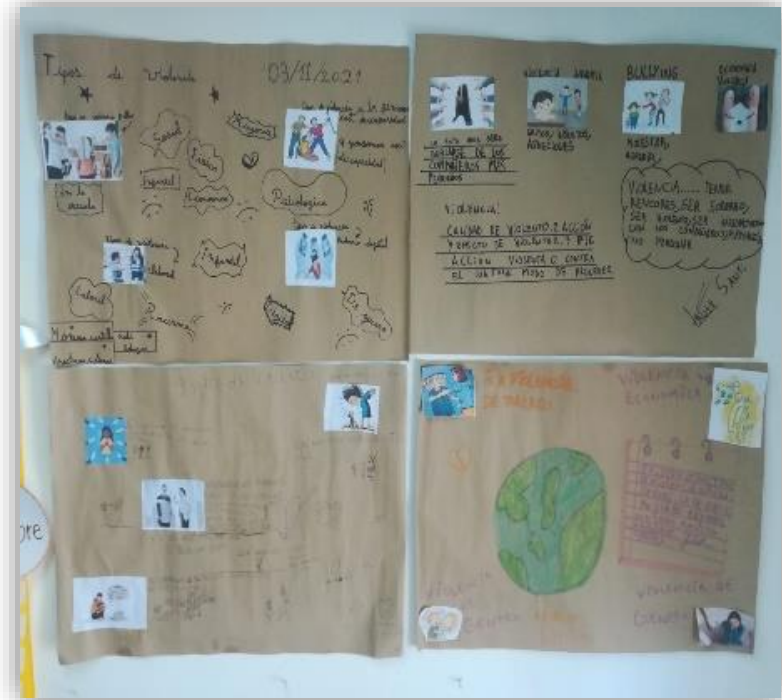
Afiches sobre los tipos de violencia

Actividades realizadas en el taller del área de plástica en conjunto con la docente de grado