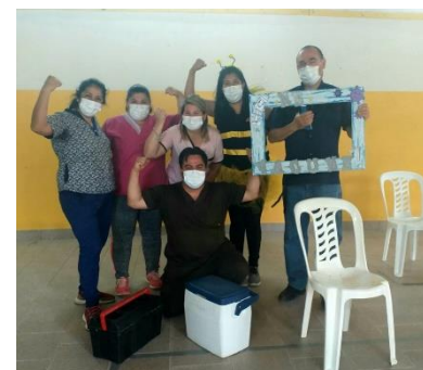
EQUIPO DEL CENTRO DE SALUD, DEL BARRIO UNIÓN.

Se aplicaron 136 vacunas de la 1º dosis y 140 vacunas de la 2º, completando el esquema de vacunación a fines del mes de noviembre del corriente año.